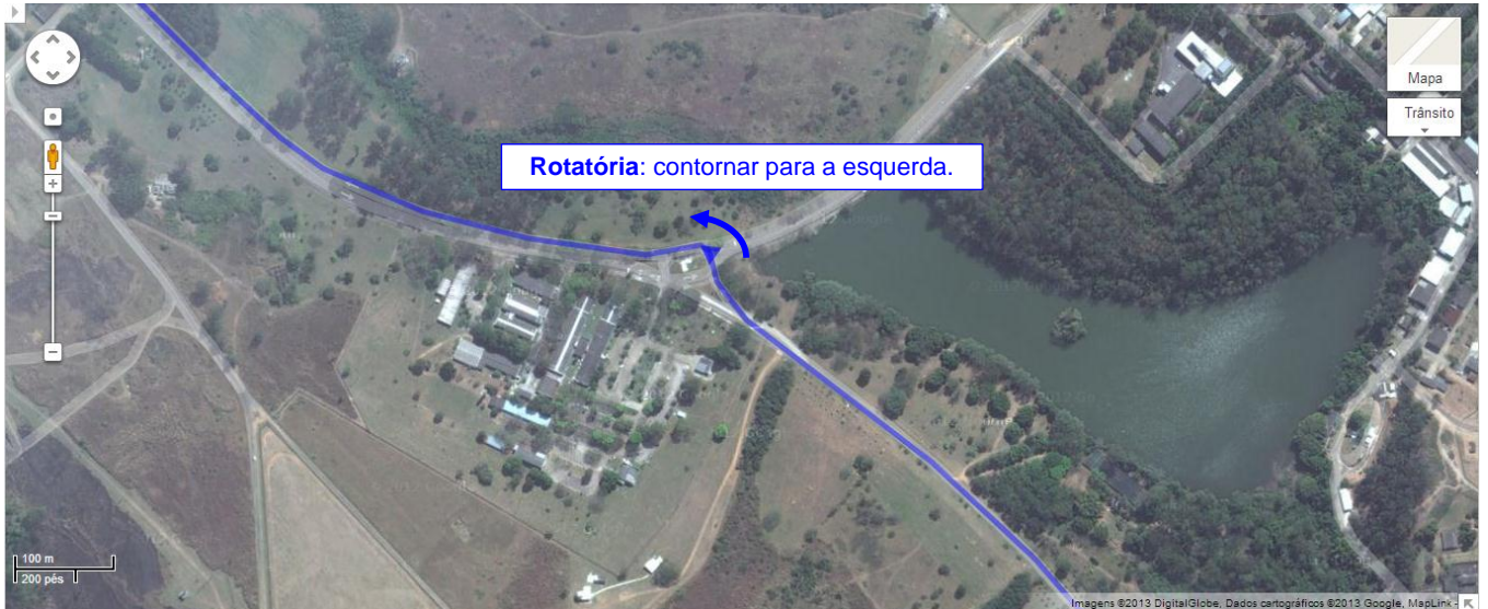
Fig. 08) Caminho completo por dentro do DCTA para se chegar aos prédios do ITA onde ocorrem as Apresentações Orais, Showroom das Aeronaves e Cerimônia de Abertura. Para se chegar a estes locais, deve se fazer o contorno conforme indicado na figura abaixo (dentro do retângulo tracejado branco) fazendo um retorno na rotatória e voltar na direção do Prédio da Eletrônica do ITA ou se possível, usar a conversão a direita mostrada na Fig. 09.

Fig. 07) Após o portão de entrada e da identificação das equipes, seguindo por dentro do DCTA na via principal de ligação do portão aos prédios do ITA, existe uma rotatória. Os veículos devem passar por esta rotatória contornando a esquerda e seguindo-se em frente na mesma via.