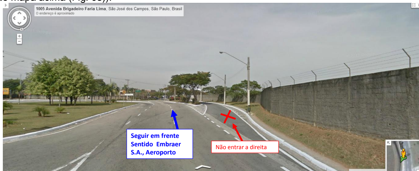
Fig. 04) Trecho próximo a chegada à Embraer. Seguir em frente e após a curva existe uma reta que leva a rotatória em frente a Embraer (esta é a rotatória mostrada na parte superior direita do mapa acima (Fig. 03)).

As figuras abaixo (Figs. 04, 05 e 06) mostram alguns pontos importantes do caminho pela Avenida Brigadeiro Faria Lima mostrado acima, para se chegar ao portão de entrada do DCTA (Fig. 01).